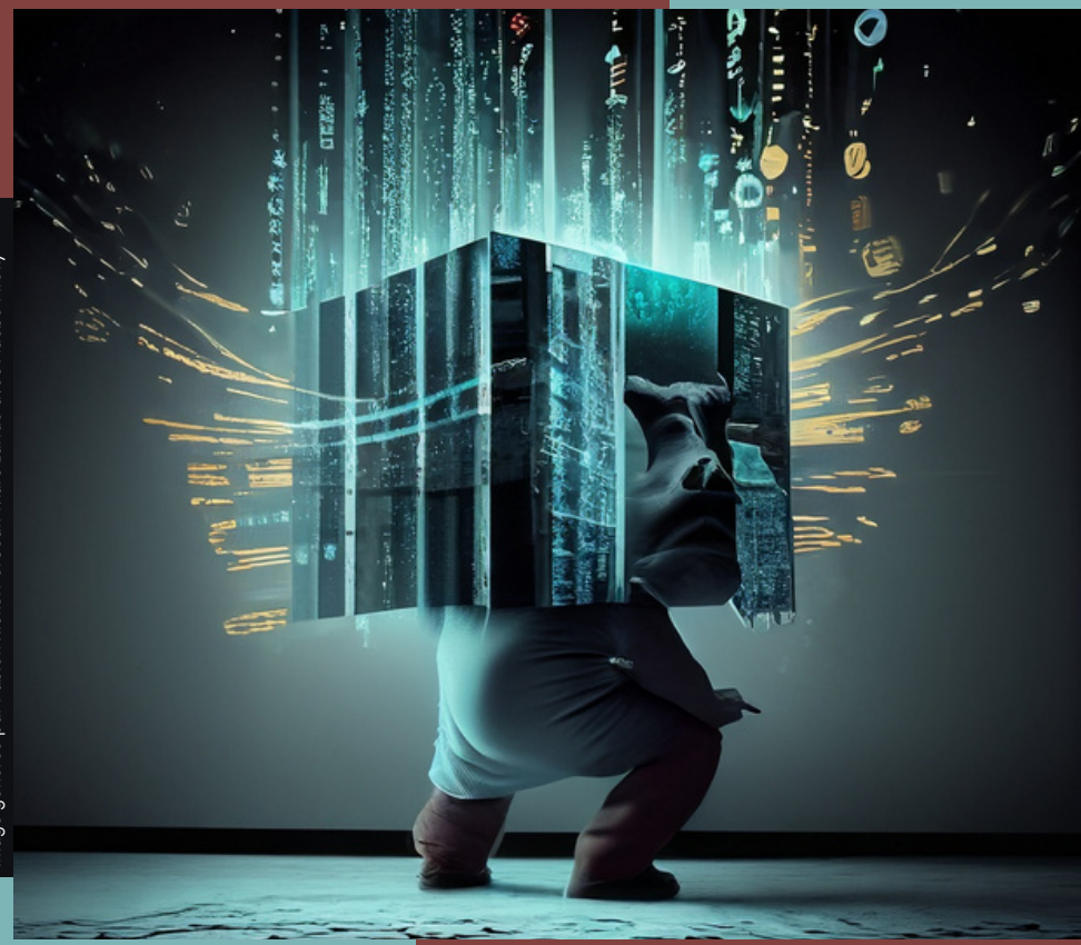
image générée par Fabien Richert et Jean-Marc Larrue avec Adobe Firefly

Sous la responsabilité de Fabien Richert (CRILCQ, UQAM) et Jean-Marc Larrue (CRILCQ, Université de Montréal)